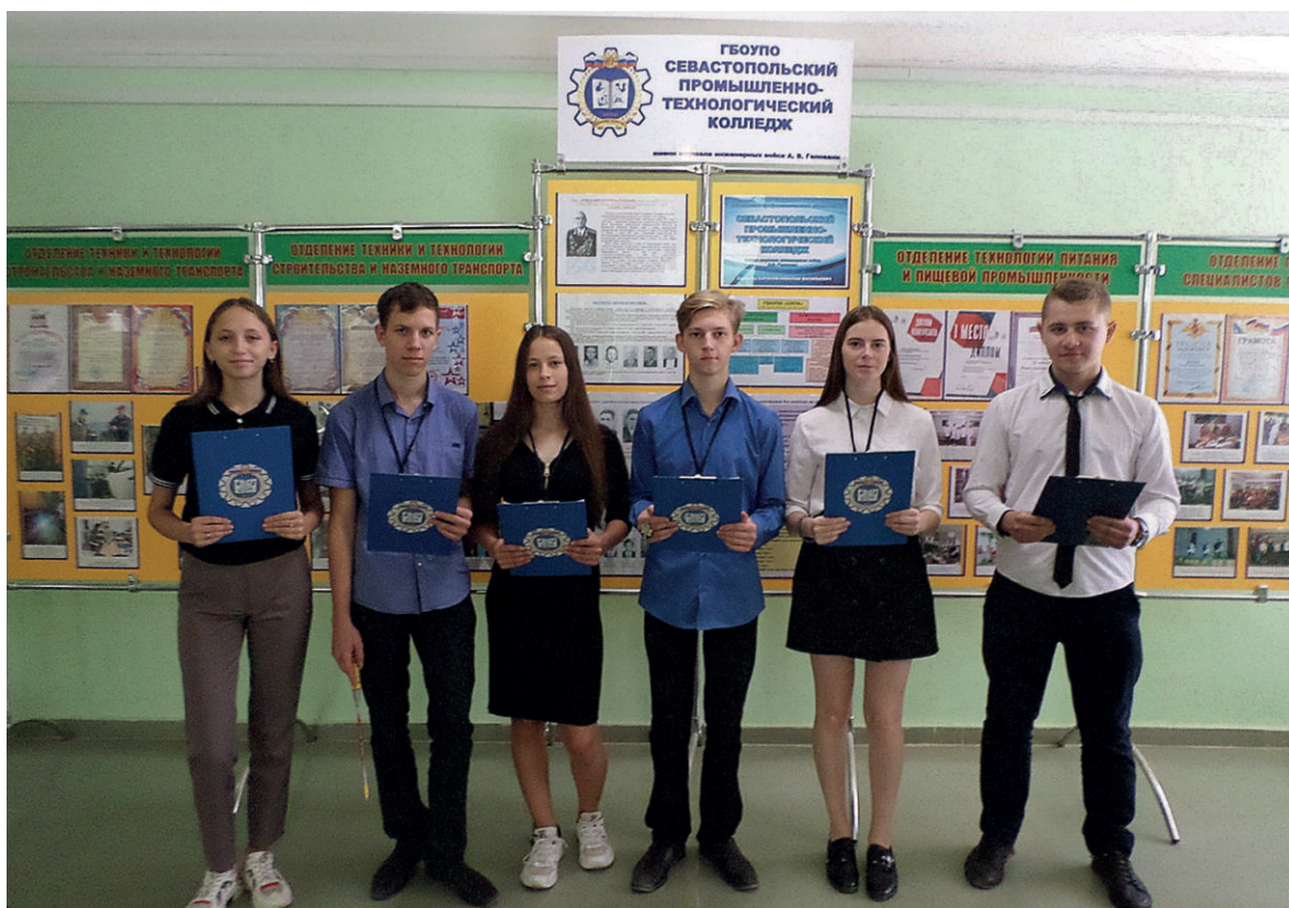
Экскурсию по музею ведут студенты колледжа