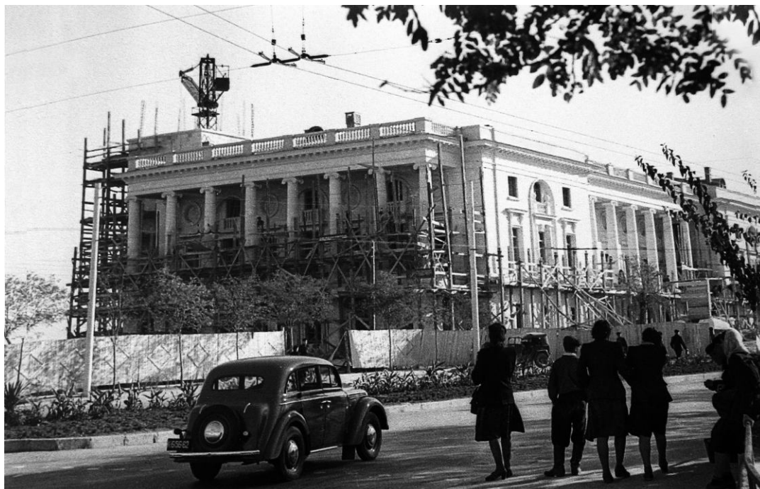
Военные строители возводят здание Матросского клуба. 1954 г.