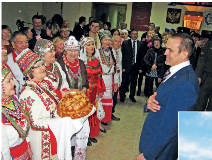
Хлеб-соль — Главе Чувашии М. Игнатьеву. 2015 г.

В феврале 2015 года в Крыму и Севастополе с рабочим визитом побывала делегация руководства Республики Чувашии, в составе которой были министры, депутаты Госсовета республики, руководители крупных предприятий. Тепло прошла встреча Главы Чувашии Михаила Игнатьева с членами Севастопольского чувашского общества, среди которых есть и его односельчане.