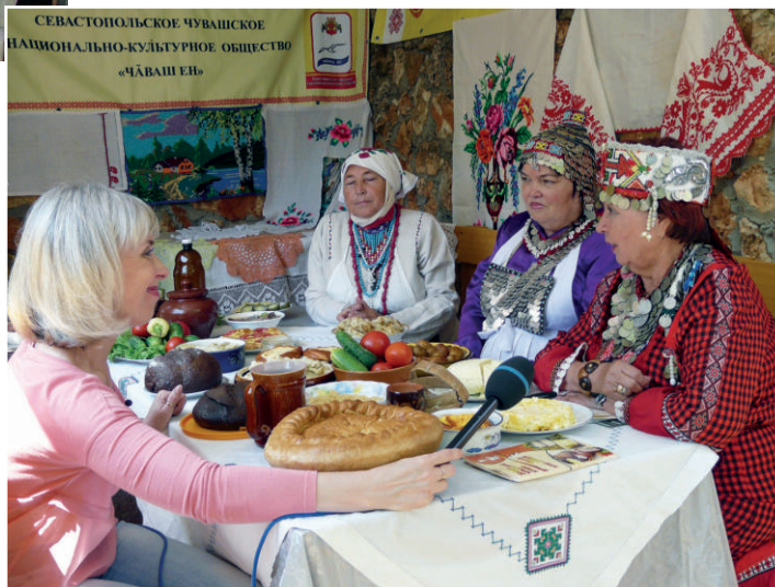
На съёмках передачи о чувашской кухне. 2017 г.