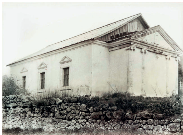
Общий вид церкви. 1980-е гг.

В середине 1980-х годов кандидат исторических наук А. В. Иванов составил описание состояния Константино-Еленинской церкви, планы южного и западного фасадов, а также выполнил фотофиксацию храма. По типу здание относится к церквям зального типа средних размеров. Апсида храма глухая, ориентирована на восток и имеет внутренний радиус около 2,5 метра. Плечи храма слабо выражены, так как постройка стоит на слабом грунте. Стены здания невысокие. Кладка выполнена из разномерных известняковых блоков. По периметру здания устроен профилированный каменный карниз. В четырёх метрах от северной стены храма устроена крепида из грубо отесанных блоков среднего размера на известковом растворе. Южная и северная стены имеют по три прямоугольных окна, украшенных треугольными сандриками. С западной стороны к зданию церкви примыкает портик из четырех колонн ионийского ордера,