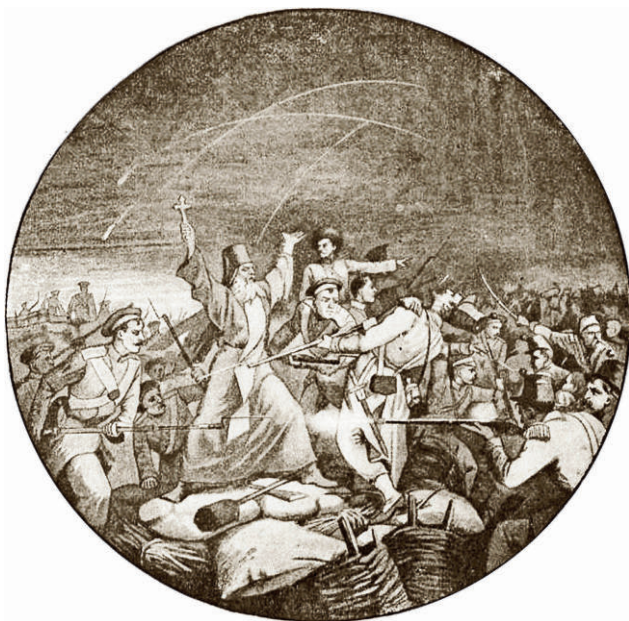
Бой на Камчатском люнете