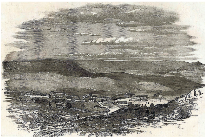
Деревня Карань близ Балаклавы. The Illustrated London News. June 9, 1855. P. 284

В вопросе об истории Константино-Еленинской церкви, безусловно, вызывает интерес записка архиепископа Гавриила (1848 г.), содержащая информацию о строительстве в селении Карань около 1833 года церкви Вознесения Господня, однако более поздние источники опровергают эти сведения. Вероятно, была проведена реконструкция здания