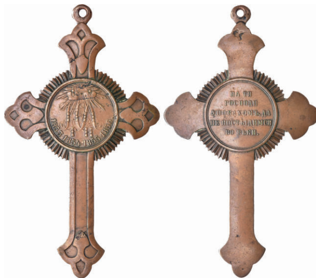
Наперсный крест памяти Крымской войны

Так, в ночь с 15 на 16 октября 1853 года пятитысячный турецкий отряд внезапно напал на слабо охранявшееся укрепление Св. Николая на Кавказском побережье, почти поголовно вырезав его защитников. Вместе с гарнизоном погиб и иеромонах Серафим. Иеромонах Балаклавского монастыря Арсений, находясь на Корниловском бастионе, 2 февраля 1855 года получил ранение в голову, приведшее к потере зрения левого глаза.