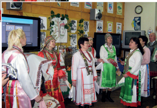
Сцена из спектакля по поэме К. Иванова «Нарспи»

лог деревообрабатывающей промышленности по специальности, возглавляющая организацию до настоящего времени. Л. Е. Тавлуй направила работу на осуществление давней мечты всех членов Общества — постановку литературно-музыкальной инсценировки поэмы классика чувашской литературы Константина Иванова (1890–1915) — поэмы «Нарспи» (1908). Это сложное, многоплановое лирико-эпическое произведение является как бы символом и энциклопедией чувашской народной жизни. Стихи из «Нарспи» — живительные и незамутнённые родники чувашского языка. Поэма переведена на языки многих народов мира, а в самой Чувашии создан целый культ «Нарспи» — поставлены пьесы, созданы две оперы и балет, названы этим именем многие вокально-инструментальные ансамбли.