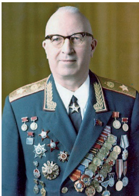
Маршал А. В. Геловани

Арчил Викторович Геловани родился 14 ноября 1915 года в горном селении Спатагори Лечхумской области Грузии —