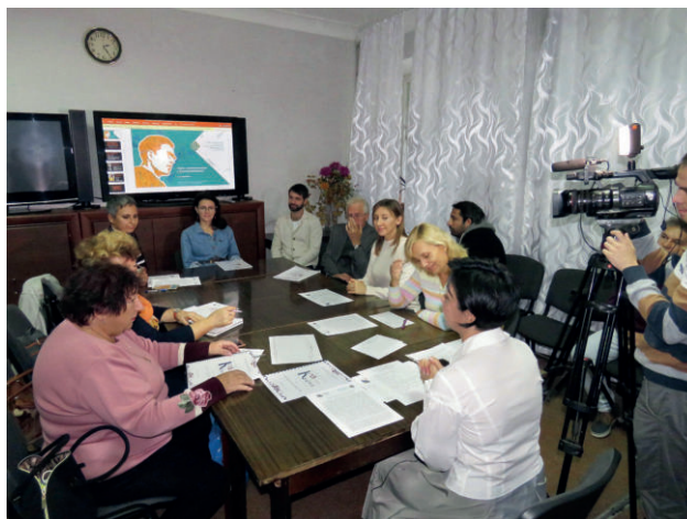
Презентация проекта Фонда Изидинова в Севастопольском городском национально-культурном центре