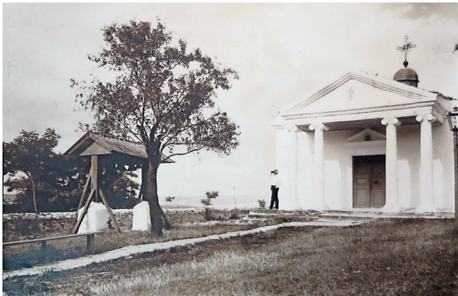
Село Карань. Церковь Святых Константина и Елены с деревянной колокольней. 1913 г.

власти, указывалось «каменное здание, имеющее одну дверь и шесть оконных проёмов, одноглавое, подвального помещения нет». В графе «другие постройки» указывались одноэтажный, однокомнатный домик-сторожка и деревянная колокольня с четырьмя колоколами. В описи церковного имущества значились два Евангелия (на русском языке — в металлическом переплёте, на греческом — в серебряном), два настольных серебряных креста, три дарохранительницы (серебряная, вызолоченная и походная), три серебряные иконы и 60 деревянных, 16 лампад, четыре хоругви (две металлических и две полотняных) и др. В церкви была круглая медная печать, которую изъяли органы власти, чтобы она не использовалась для