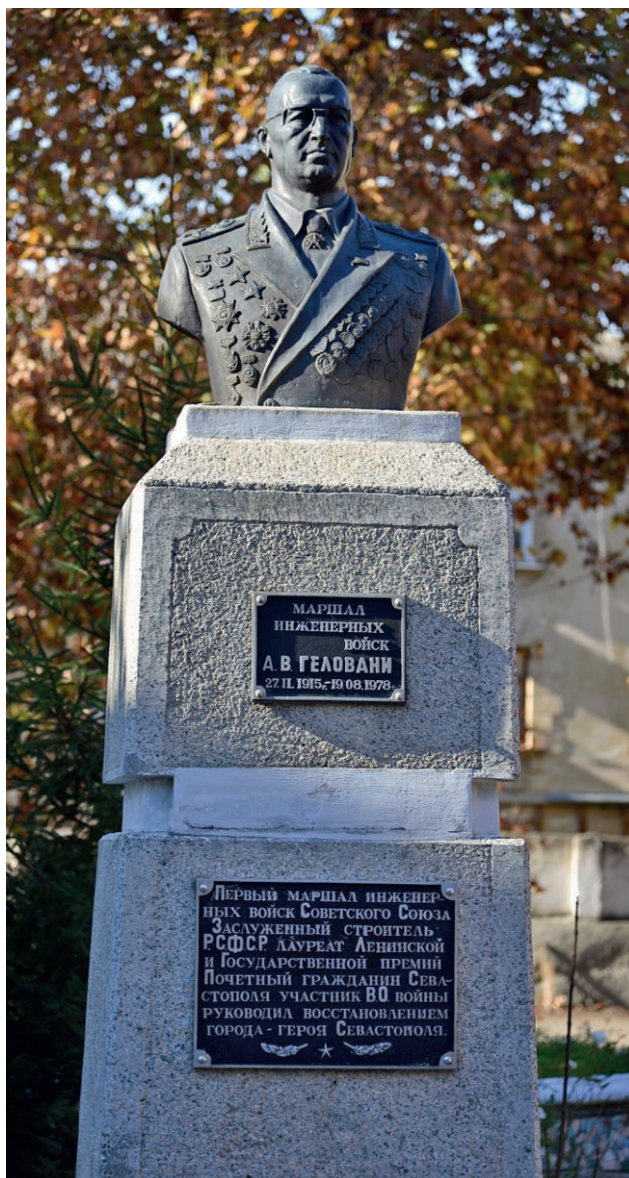
Памятник маршалу А. В. Геловани на территории колледжа

А. В. Геловани назначается главным инженером специального строительства, а с апреля 1942 года — начальником специального строительства № 11 Черноморского флота.