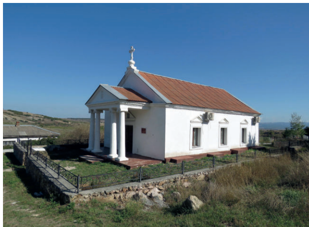
Село Карань. Церковь Святых Константина и Елены. Вид после ремонта. 2019 г.