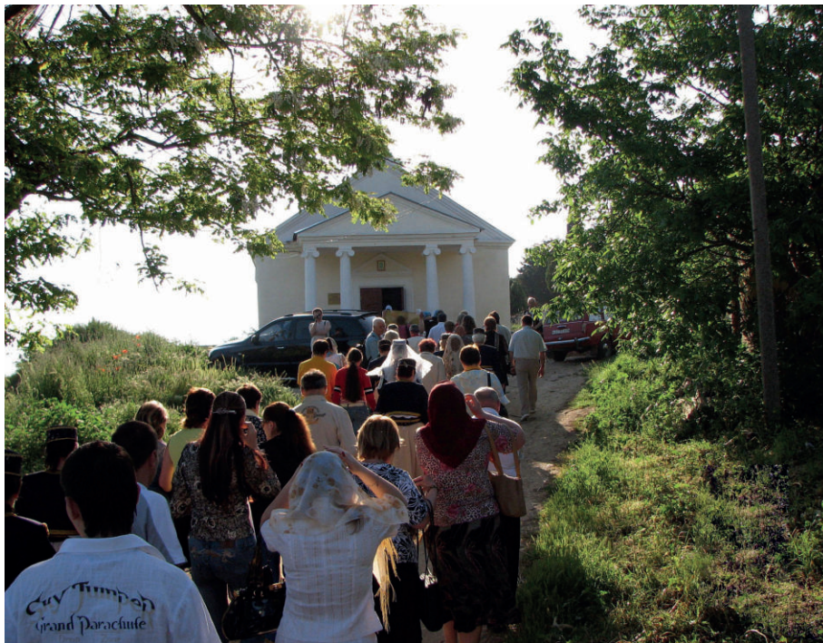
На праздничную службу спешат гости из мариупольской Карани. 2008 г.

Вновь звучали на сельской площади старинные греческие мелодии и песни на урумском языке 2 . Мариупольцы помнят о своих корнях, сохраняют язык предков и хотят вернуть своему селу историческое название — Карань.