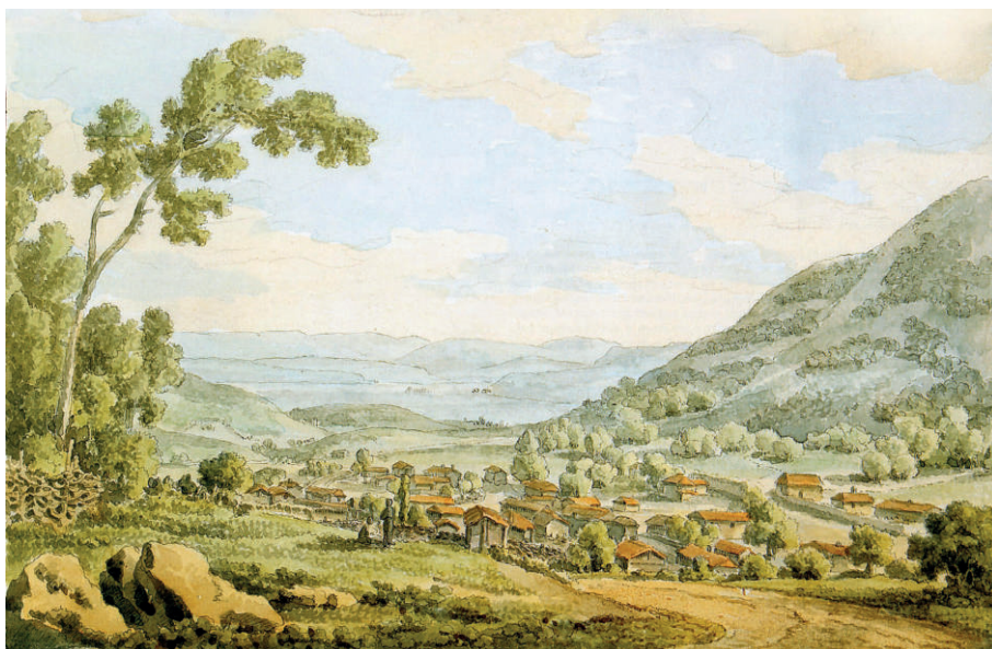
М. М. Иванов. Селение Карань. 1783 г.

В самом раннем источнике после присоединения Крыма — «Ведомости о числе церквей христианских в Крымском полуострове, целых и разрушенных», составленной 17 декабря 1783 года, значится: «В Каране — 2», в графе «разрушенных» стоит прочерк. Вместе с тем в «Ведомости какое число во всем Крымском полуострове находилось кадылыков и в каждом кадылыке какие христианские деревни и пол-