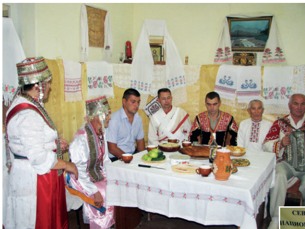
Показ чувашского обряда проводов в армию. 2010 г.

нарского, Цивильского и других сельскохозяйственных техникумов приезжали в сёла Севастопольского региона на производственную практику. Многие были направлены сюда на работу после окончания учёбы, остались в Крыму, обзавелись семьями, но не позабыли о своих чувашских корнях.