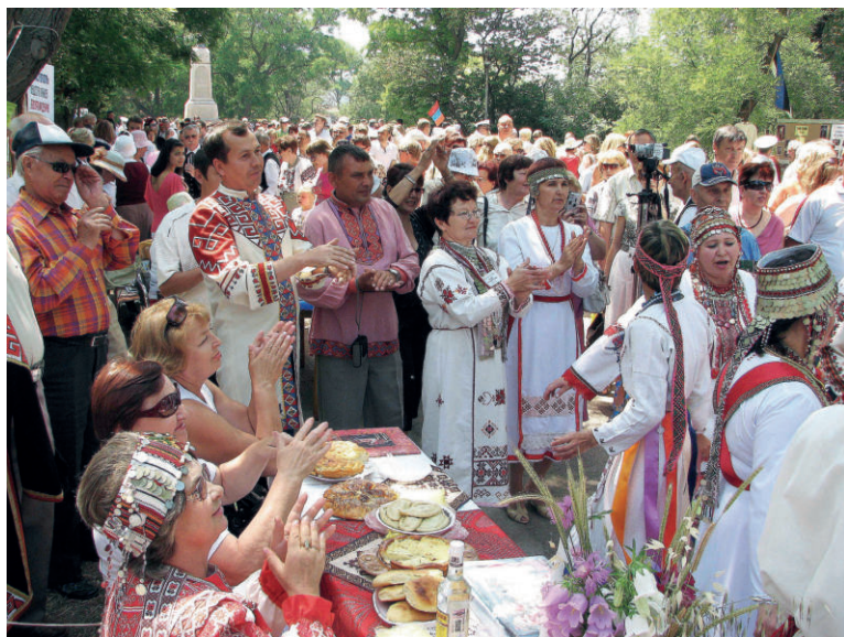
Чуваши на празднике Исторического бульвара

С рассказами о Чувашии и чувашах выступают члены Общества и перед школьниками в замечательной детской библиотеке Дружбы народов. Ряд мероприятий, сопровождавшихся выступлением ансамбля «Туслах», был подготовлен для студентов севастопольских вузов. Члены Общества принимают участие и в тематических передачах севастопольских телеканалов.