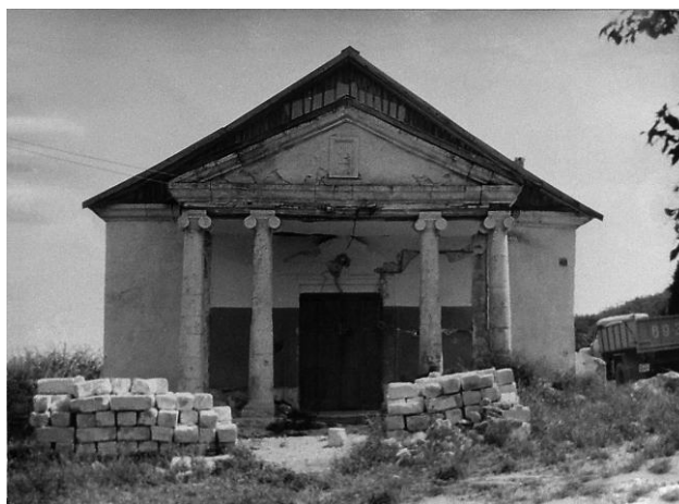
Западный фасад. Портик. 1992 г.