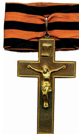
Золотой наперсный крест на Георгиевской ленте

Попробуем проследить, как справлялись с исполнением этих задач военные священники Российской императорской армии и флота в ходе боевых действий Крымской войны 1853–1856 годов.