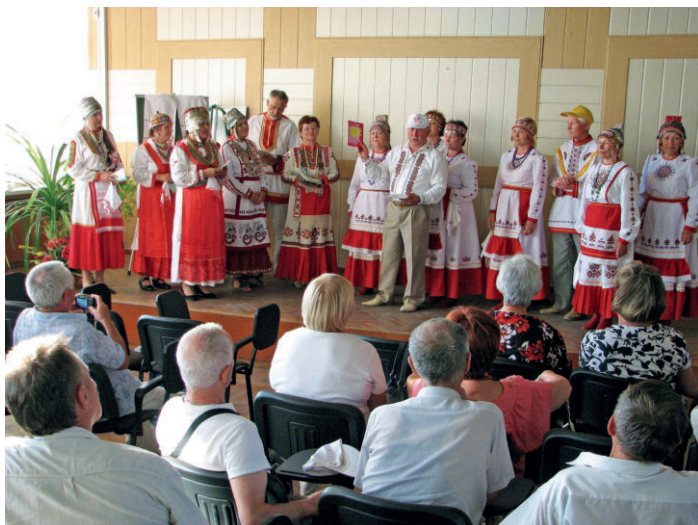
Творческая встреча с чувашами из Уфы. 2014 г.