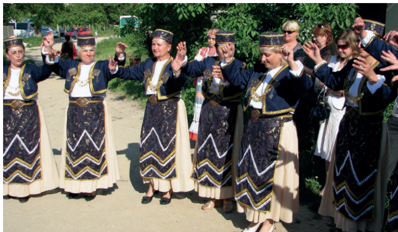
Выступает фольклорный ансамбль села Гранитного. 2008 г.

В начале 1990-х годов правительством Украины многие культовые сооружения были возвращены религиозным общинам. В 1994 году, спустя 61 год после ликвидации, вос-