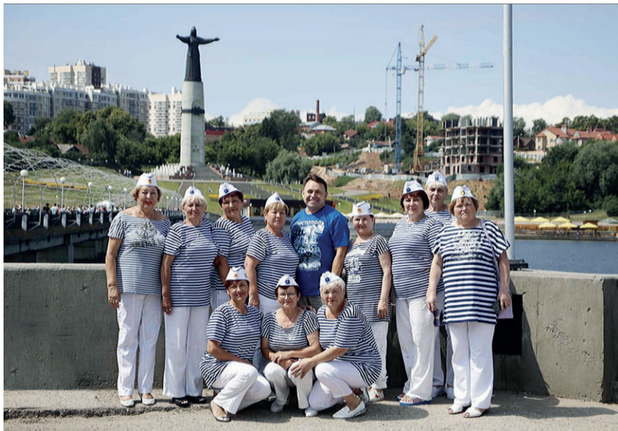
Делегация Севастопольского чувашского общества в Чебоксарах

Везде принимали нас радушно, с большой любовью. Дома, в Севастополе, мы всегда выступаем в народных чувашских костюмах, а для поездки в Чувашию взяли с собой тельняшки и пилотки. Эта наша форма имела оглушительный успех. Нас узнавали везде, подходили, интересовались нашей работой, жизнью в Севастополе, фотографировались. Отраднo было осознавать, что город наш знают и любят.