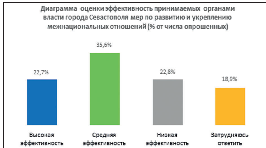
Диаграмма оценки эффективности принимаемых органами власти города Севастополя мер по развитию и укреплению межнациональных отношений (% от числа опрошенных)

В связи с этим для эффективной реализации внутренней политики в регионе необходимо решение задач социально-экономического развития Севастополя, направленных на создание новых рабочих мест для жителей региона, поддержку сельскохозяйственного производства, мелкого и среднего бизнеса, что позволило бы поднять благосостояние населения. Вместе с тем возрастает роль проведения и популяризации национальных и межэтнических мероприятий, направленных на культурное просветительство, корректировку стереотипов массового сознания и формирование идеологии общегражданского единства. Это — одна из задач, стоящих перед редакцией журнала «Севастополь многонациональный».