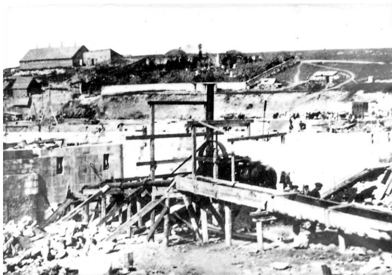
На заднем плане — воинское еврейское кладбище в Панайотовой балке. Начало XX в.