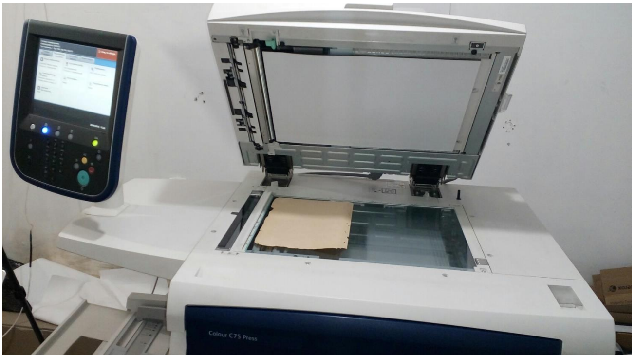
Рисунок 1 Полноцветное МФУ Xerox Color C75 Press

На основе этих рекомендаций и с учетом имеемых технических и финансовых возможностей было приобретены два внешних жестких диска (HDD) типа Western Digital WD10EZEX Caviar Blue, SATA III емкостью 1ТВ и специальные корпуса к ним. Такое решение было принято с учетом надежности дисков и возможности в перспективе их использования в компьютерном оборудовании (персональный компьютер, серверное оборудование). Для записи мастер-копии было принято решение использовать диски типа DVD емкостью 4,7 GB. Для мобильного применения приобретены флэш-накопители емкостью 8 и 16 GB.