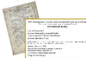
Библия, 1737 г. и картонка единицы хранения