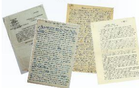
Личная переписка и документы из архива Д.М. Гумуша

В ходе выполнения работы опубликовано 6 статей и заметок в газетах, сборниках, интернет-изданиях, дана информация на телевидении.