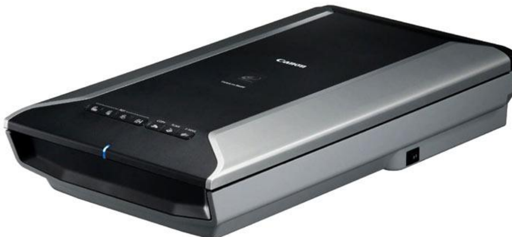
Рисунок 2 Планшетный сканер CanoScan 5600F

Для выполнения оцифровки архивных документов и обработки полученных данных был выполнен поиск и выбор программного обеспечения (ПО).